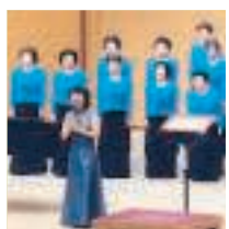
Il coro femminile Sakukurai questa sera a Catania nella chiesa di San Pietro e Paolo

Letipiche sonorità giapponesi incontrano alcune delle arie più famose di Vincenzo Bellini e brani della tradizione popolare siciliana. Nella chiesa di San Pietro e Paolo a Catania, questa sera alle 21, il coropolifonico Imago Vocis ospita il coro femminile giapponese Sakukurai. Il direttore del coro, fondato nel 1987, è il maestro Michiko Aoki, mezzosoprano che dopo essersi laureata in Giappone ha poi studiato a Milano, a Roma e a Madrid. È attualmente insegnante universitaria di lirica presso la Tokyo Geijutsu Daigaku e svolge un'intensa attività concertistica in giro per il mondo. L'ingresso alla chiesa di San Pietro e Paolo è gratuito.