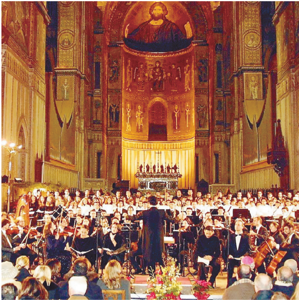
Un concerto al Duomo di Monreale in occasione della Settimana di Musica Sacra